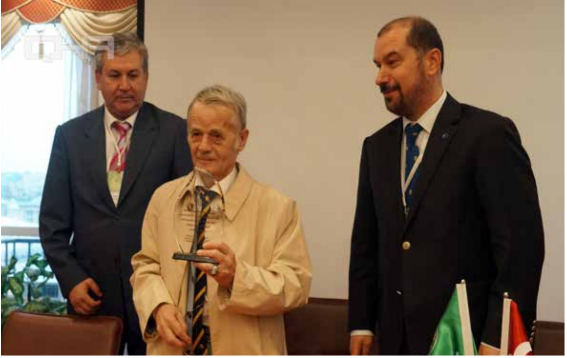
Kırım Tartarları Milli Lideri Mustafa Abdülcemil KIRIMOĞLU