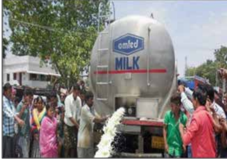
Resim 6: Hindistan'ın süt üretiminin her yıl yaklaşık % 4,4 artacağı tahmin edilmektedir.

Hindistan, çiftçileri, sürüleri ve müşterileri için en iyi çözümleri sağlayacak yenilik bulma çabalarını günümüzde de sürdürmektedir.