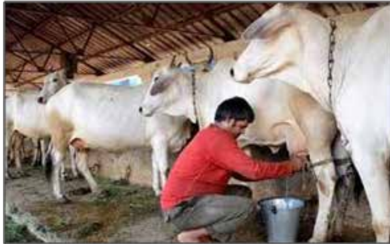
Resim 7: Hindistan'da dokuz başlık bir işletmenin ürettiği çiğ sütbaşına düşen işçi maliyeti ile ABD'deki 350 baş kapasiteli bir işletmenin çiğ sütbaşına işçi maliyeti aynıdır.

Hindistan, dünya toplam süt üretiminin %18'ini üreterek dünyanın en büyük süt üreticisi durumundadır. Nüfus özellikleri nedeniyle süt üretimi ve ürünlerinde büyük potansiyel ihtiva etmektedir. Hindistan'da sağlıklı yaşam için süt kullanımı giderek yaygınlaşmaktadır.