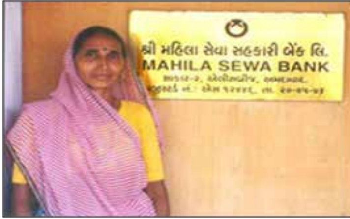
Resim 2: Maharashtra'da bir kooperatif bankası olan Mahila Sewa Bank, çevredeki kadın sütçülere bankacılık ürünleri hakkında temel bilgiler öğretiyor.

Hindistan'daki başarılı kooperatifçilik uygulamalarına bakıldığında özellikle küçük ölçekli sermayeye sahip kadın grupların yer aldıđı gözlenmektedir.