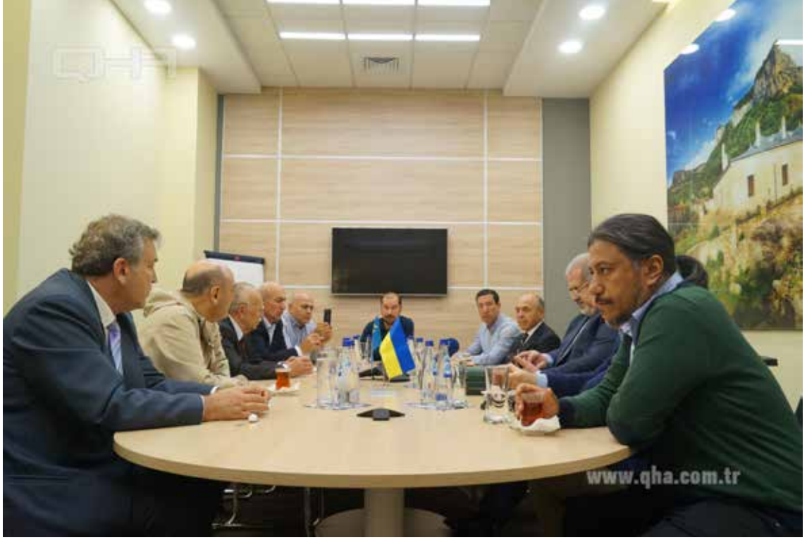
Kırım Tatar Meclisi Ziyareti