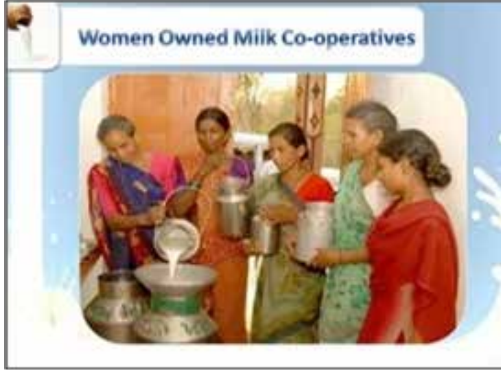
Resim 3: Hindistan'da kadınlarca kurulmuş bir kadın süt kooperatifi

Bu soruna çözüm bulmanın tek yöntemi Sri Lanka'nın güneyindeki kadın kooperatif bankalarına benzer kadın kooperatif bankaları kurmak ve sayılarını artırmaktır.