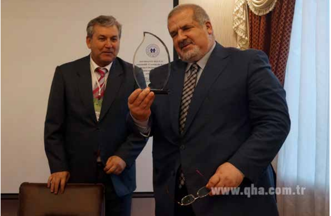
Kırım Tatar Milli Meclis Başkanı Rafet ÇUBAROV